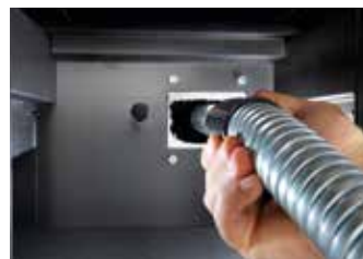
FACILE PULIZIA TUBO SCARICO FUMI Easy-to-clean exhaust Facilité de nettoyage du conduit d'évacuation Leichte reinigung der abgasführung Limpieza fácil del tubo de evacuación de los humos Gemakkelijke reiniging rookgasafvoer