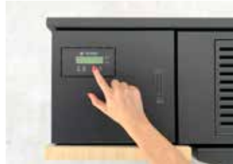
PROGRAMMAZIONE SETTIMANALE Weekly timer Programmation hebdomadaire Wochenprogrammierung Programación semanal Weekprogrammering