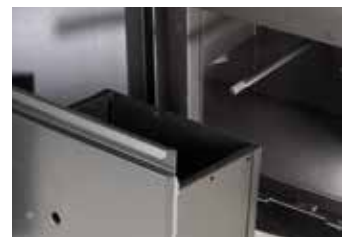
CAPIENTE CASSETTO CENERE Large ash pan Grand tiroir à cendres Großer aschekasten Cajón de cenizas amplio Grote aslade