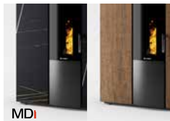
RIVESTIMENTO MDi • New MDi coating Nouveau revêtement MDi Neue MDi-Beschichtung Nuevo recubrimiento MDi Nieuwe MDi-coating