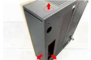
USCITA FUMI ORIZZONTALE, LATERALE E VERTICALE Horizontal, lateral or vertical flue gas outlet Evacuation des fumées horizontale, latérale ou verticale Horizontale, laterale oder vertikale abgasführung Salida de humos horizontal, lateral o vertical Horizontaal, lateraal of verticaal rookgasafvoer