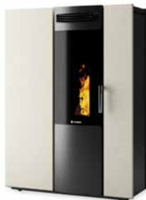
THEMA BIANCO ANTICO

Het doel van het vergemakkelijken van de installatie van de woninghaard in nauwe ruimtes en het zoeken naar elegantie van design, ligt aan de oorsprong van Thema. Een verfijnde kachel waar het mysterie van het ronde "magische" glas opgaat in de soberheid van de steen, gemaakt van pure mineralen die bij hoge temperatuur zijn gesmolten (MDi).