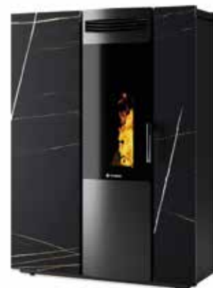
THEMA NERO AZALAI