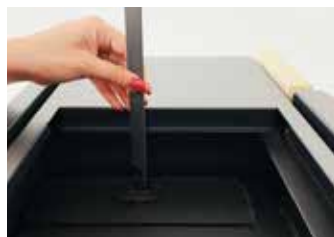
SEMPLICE PULIZIA DEGLI SCAMBIATORI Easy-to-clean heat exchangers Simplicité de nettoyage des échangeurs Reinigungsfreundliche wärmetauscher Limpieza sencilla de los intercambiadores Eenvoudige reiniging van de warmtewisselaars

Simplified ordinary maintenance Entretien de routine simplifié Einfache planmäßige wartung Mantenimiento ordinario simplificado Eenvoudig standaardonderhoud