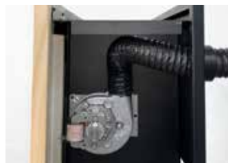
POSSIBILITÀ DI CANALIZZAZIONE CON VENTILATORE DEDICATO Ductable with dedicated fan Possibilité de canalisation avec ventilateur dédié Vorbereitung für Leitungssystem mit eigenem Gebläse Posibilidad de canalización con ventilador específico Vorbereid op gekanaliseerde warmteverspreiding d.m.v. aanjager