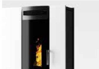
VETRO PANORAMICO CURVATO Curved panoramic glass Verre panoramique bombé Gewölbtes panoramaglas Vidrio panorámico curvo Gewölfd panoramisch glas

Attractive and adaptable to all needs. Beau a regarder et adaptable a tout besoin. Formschöne ästhetik und für jeden bedarf zugeschnitten. Bonita y adaptable a cada necesidad. Stijvol design en geschikt voor elke behoefte.